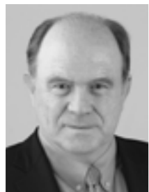
WALTER B. KIELHOLZ, MITGLIED

Präsident des Verwaltungsrates der SwissRe, Zürich